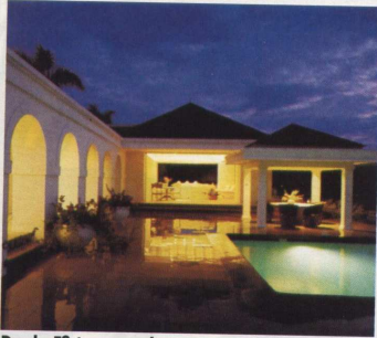
Durchs Esszimmer weht immer eine kühle Brise