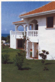
Säulenvilla, erst zwei Jahre alt