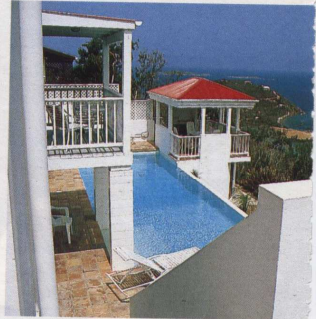
Türme rund um den Olympia-Pool