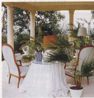
Rundherum 8 000 qm tropischer Garten