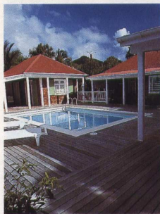
Hintern Haus liegt der Strand