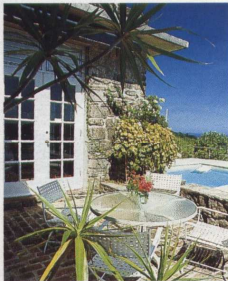
Antiquitäten unter Palmen