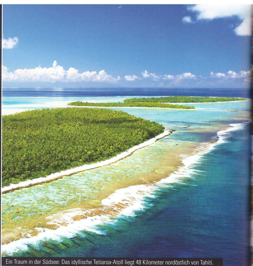
Ein Traum in der Südsee: Das idyllische Tetiaroa-Atoll liegt 48 Kilometer nordöstlich von Tahiti.

LANDMARK – fine travel experiences Aachener Straße 382 – 50933 Köln Fon +49 221 170 007 990 Mail info@landmark-fine-travel.de Web www.landmark-fine-travel.de