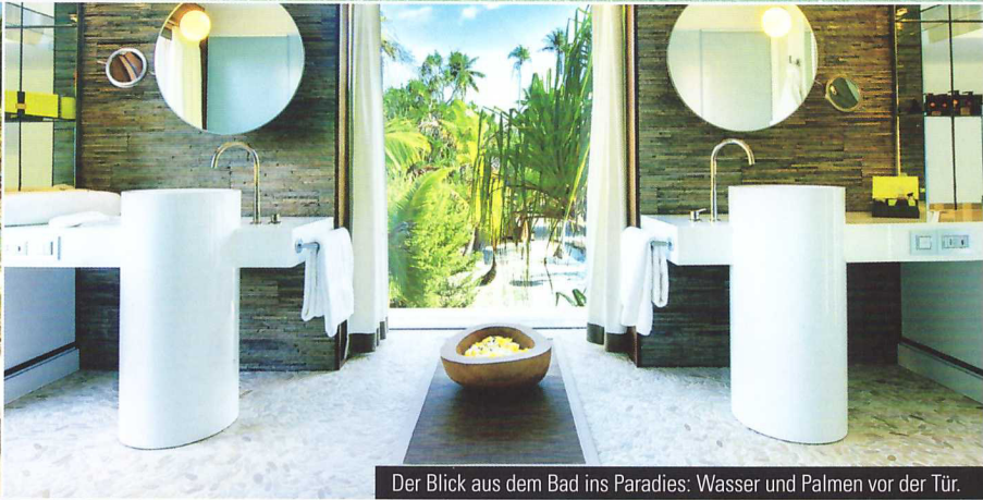
Der Blick aus dem Bad ins Paradies: Wasser und Palmen vor der Tür.