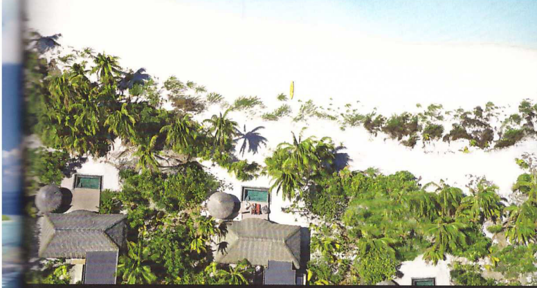
Natur pur: Für den Bau des Resorts wurden hauptsächlich natürliche Materialien eingesetzt.