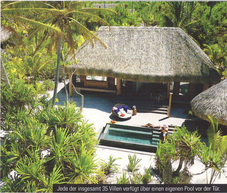
Jede der insgesamt 35 Villen verfügt über einen eigenen Pool vor der Tür.

unterstreichen die Naturverbundenheit des Resorts. Neben polynesischen und französischen Gerichten setzt das renommierte Fine Dining Restaurant von Sternekoch Guy Martin auch auf die Kombination östlicher und westlicher Geschmäcke. Die Zutaten stammen zu einem Großteil aus dem eigenen Garten. Zu einem lockeren Drink trifft man sich in der Strandbar Bob's Bar , die in Erinnerung